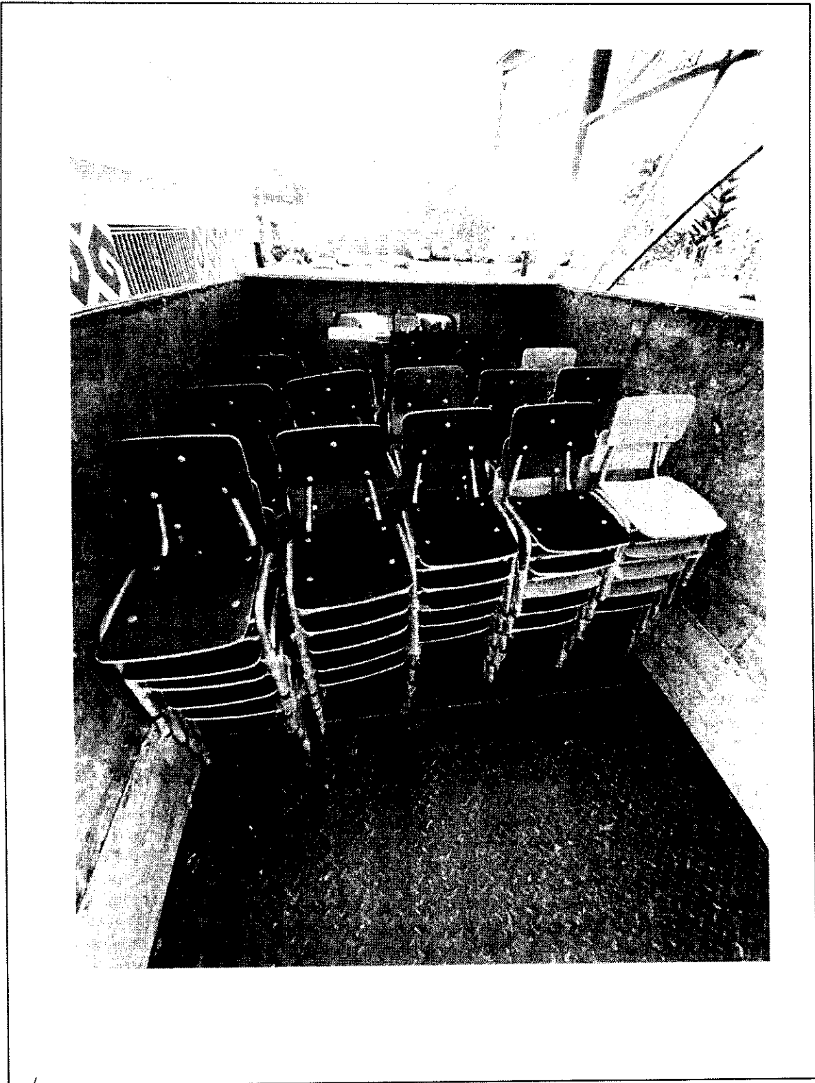
Departamento de Educación - Corporación Municipal Gabriel González Videla.